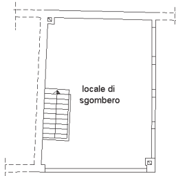
PIANO SOTTOTETTO h. m. 2,35